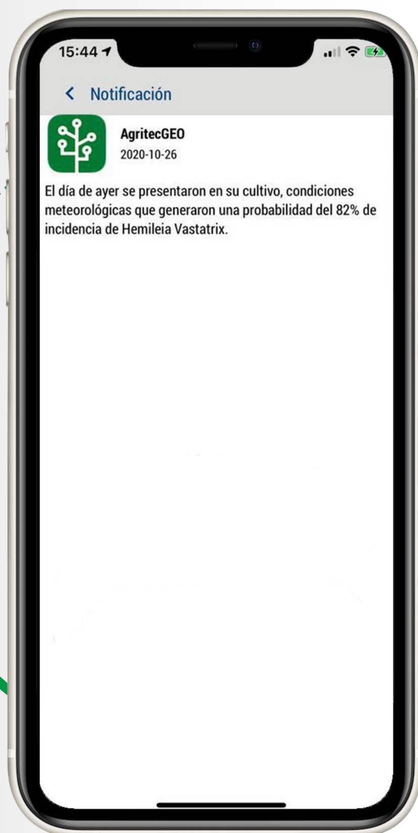
Visualización de alertas que los usuarios de AgritecGEO® reciben en sus teléfonos.

El uso de productos amigables hacia los insectos polinizadores es una de las mejores opciones dentro de los programas de manejo integrado de plagas y enfermedades. DISAGRO cuenta dentro de su portafolio con este tipo de productos dentro de los que se destacan: Regalia Max, Supralid y Futron, que no solo presentan un excelente control contra su agente biótico objetivo sino que además se caracterizan por ser amigables con insectos polinizadores especialmente las abejas. Tanto el servicio de ventana de aplicación como el servicio de pronóstico de incidencia de plagas y enfermedades es recibido por los usuarios de AgritecGEO ® mediante notificaciones que le llegan a su teléfono con la frecuencia requerida.